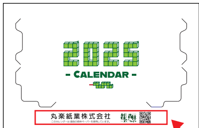
卓上型カレンダー