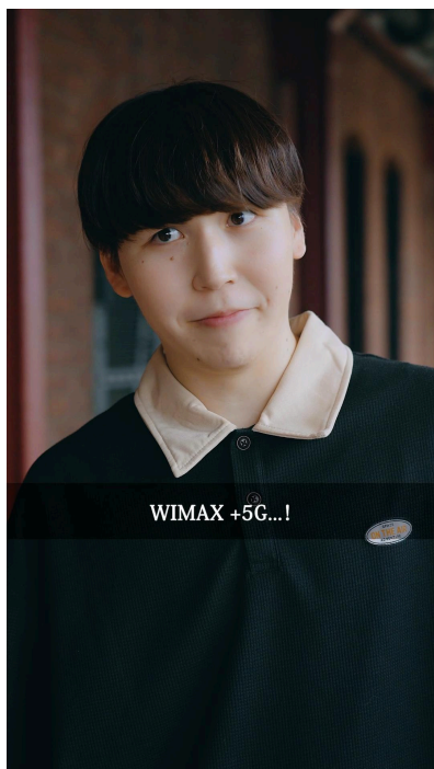
TikTokクリエイター いっぺい(✦きょんぺい👉)