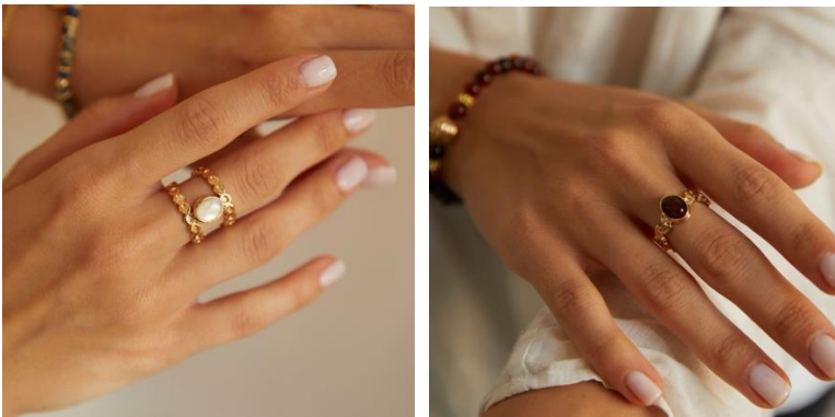
DOUBLE RANGS リング

https://elleshop.jp/web/commodity/000/344101903901/