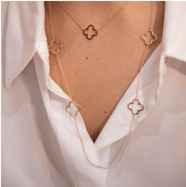
TREFLE SOLITAIRE ネックレス

https://elleshop.jp/web/commodity/000/344101901401/