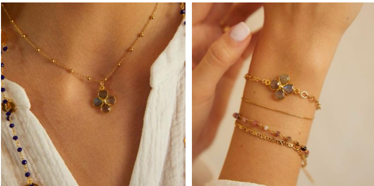
MARGUERITE GRIS ネックレス

https://elleshop.jp/web/commodity/000/344101901301/