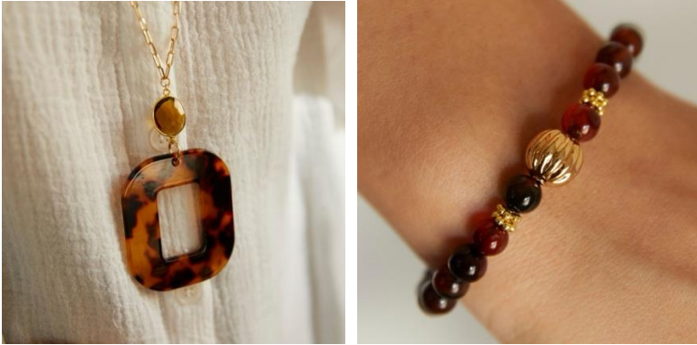
AMBRE ロングネックレス

https://elleshop.jp/web/commodity/000/344101900101/