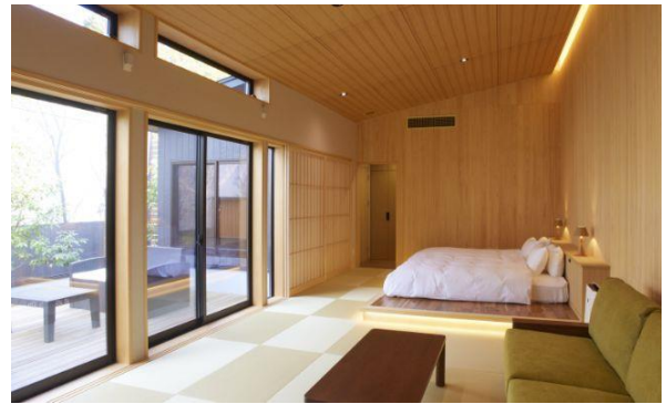
木々に佇む7つの完全離れの“大人の隠れ家”が人気の「山の手別邸葉隠れ」

山の手ガーデンは、道後温泉本館から徒歩5分の場所にある、美術館、宿泊施設からなる総合施設です。「芸術と自然が織りなす、上質な時間と空間」をコンセプトに、隠れ家的な雰囲気漂う宿泊施設「山の手別邸葉隠れ」と、和食を中心とした創作料理が楽しめる「葉山茶寮」が人気です。道後温泉周辺の観光スポットとして有名で、季節に応じた花々が咲き誇る広大な敷地の庭園を散歩することができ、自然と芸術が融合した空間を楽しめます。（※現在、「葉山茶寮」は「山の手別邸葉隠れ」の宿泊者のみの利用となります）