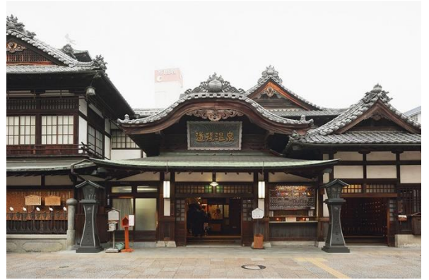
道後温泉本館は、平成31年1月から、営業しながらの保存修理工事に着手。休憩室がある2階以上は休館していますが1階で入浴可能

約3,000年の歴史を誇り、日本最古の湯と言われる道後温泉のシンボルです。ミシュラン・グリーンガイド・ジャポンの3つ星を獲得し、平成6年には公衆浴場として日本で初めて国の重要文化財となりました。建物は1894年に改築された木造3階建てで、令和6年末まで営業しながら保存修理工事に着手。休憩室がある2階以上は休館していますが1階の霊の湯に入浴でき、令和6年7月中には全館営業再開予定です。