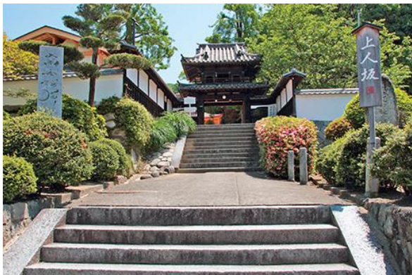
境内には子規の句碑「色里や十歩はなれて秋の風」や、斎藤茂吉の歌碑が立つ。愛媛県指定史跡