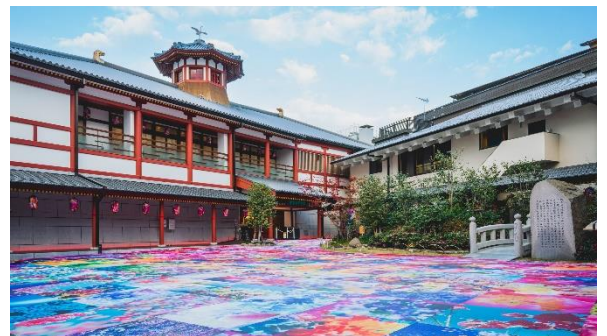
中庭には蜷川実花の作品「道後温泉別館 飛鳥乃湯泉中庭 インスタレーション」を2024年2月末(予定)まで展示中

聖徳太子や斉明天皇も訪れたという道後温泉の伝説にちなみ、飛鳥時代の建築様式を取り入れて建てられた、道後温泉で一番新しい湯屋です。源泉かけ流しの湯を満喫でき、1階浴室には露天風呂もあります。館内は「太古の道後」をテーマに、道後温泉にまつわる伝説や物語を愛媛の伝統工芸を用いた最先端アートで表現しています。2階にある約60畳の大広間休憩室、5室の個室休憩室、2室の特別浴室ではお茶とお菓子のサービスがあります。本館の皇室専用浴室(又新殿)を再現した特別浴室では昔の浴衣(よくい)「湯帳(ゆちょう)」を着用した入浴体験も出来ます。