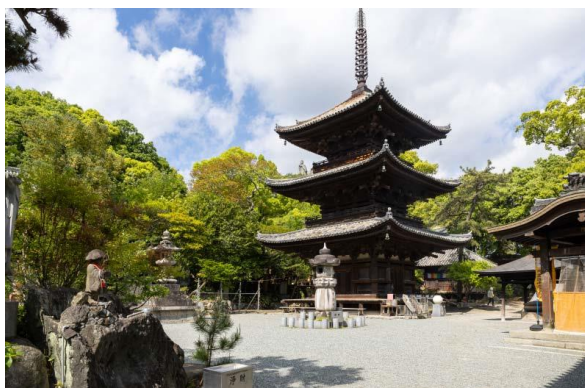
高さ約 24 メートルの三重塔。 鎌倉時代の三重塔のなかで最も優れているといわれています。