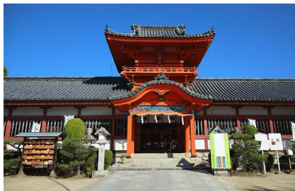
昭和 31 年に本殿が国の重要文化財に指定、同 42 年には全体が追加指定を受けました。