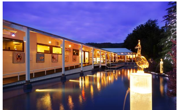
水と緑あふれる美しい庭園に囲まれた美術館。夜は幻想的な風景が広がります。