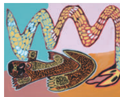
「ヘビマンガウス」 山野将志