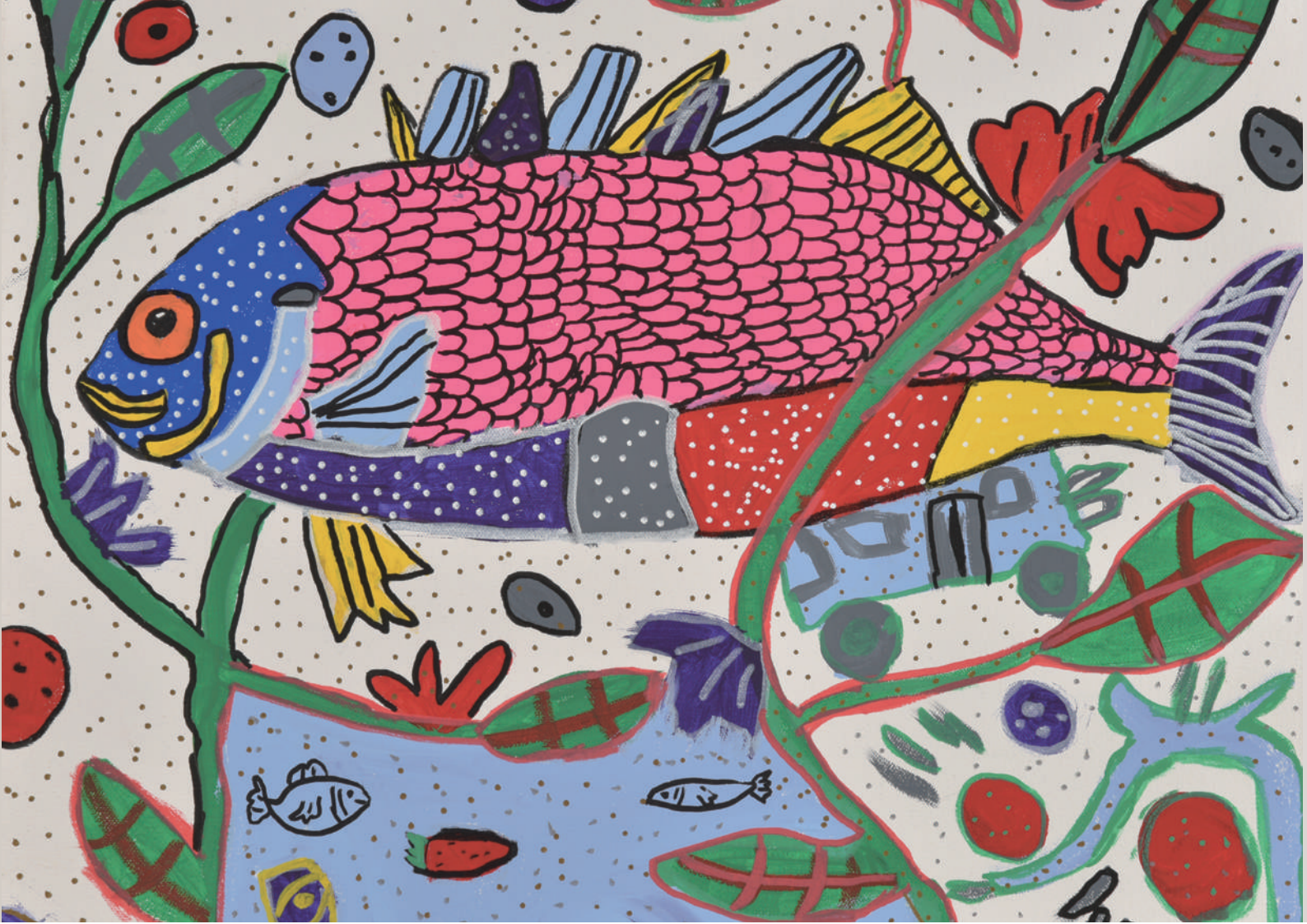
「さかなが、さいたので、いろいろです。」 風香