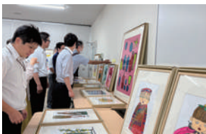
ならコープの職員とアート作品の「お見合い」の風景