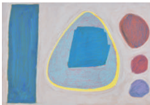
「トンネルしかくまるさんかく」 青木優