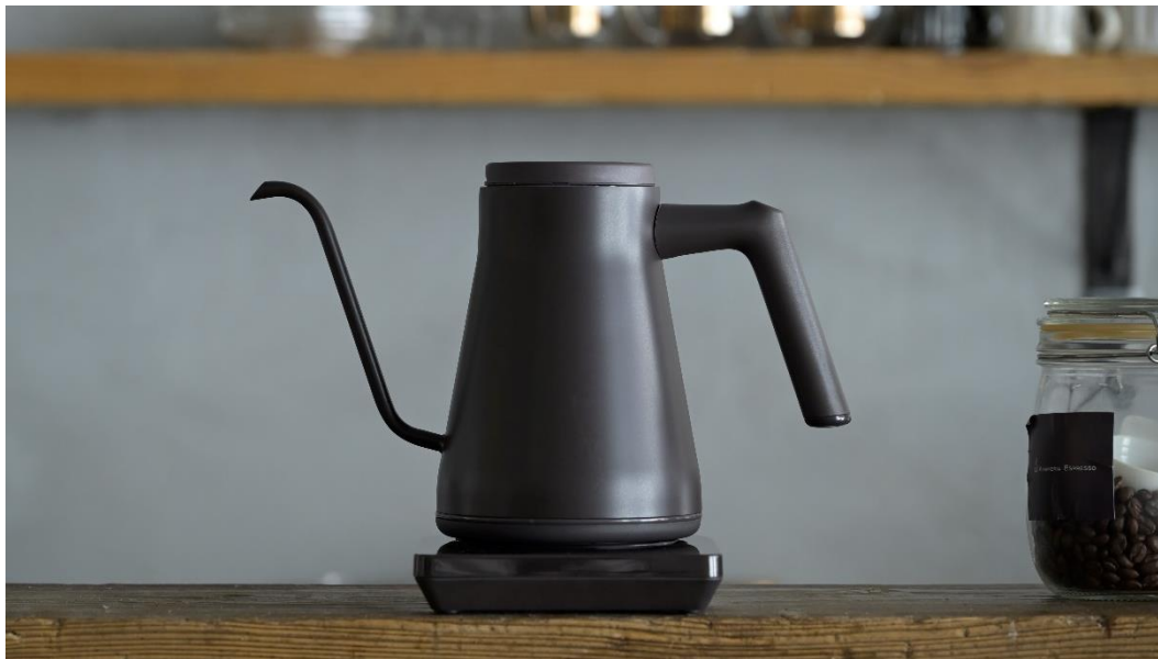
電気式バリスタポット YKR-SC1280

「電気式バリスタポット」は、取っ手と細口ノズルの重量バランスと、蒸気口を塞ぐフタの新構造により、誤って倒れた際にもお湯が漏れにくい安全性を実現しています。乳幼児の火傷のリスクを軽減し、ご家族でも安心してご使用いただけます。加えて、コーヒーのドリップ時に最適なドリップ時間をカウントアップする新機能と、真下にドリップできる新細口ノズルを搭載しました。こだわりのマットな質感のデザインは、キッチンに馴染むお洒落な空間を演出します。安全性・機能性・デザイン性を兼ね備えながらも、12,100円とリーズナブルな商品です。