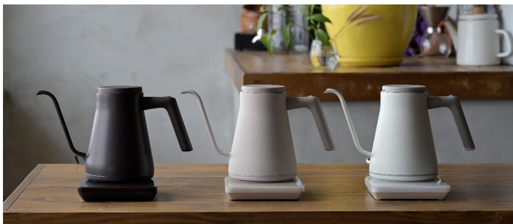
(左から) コーヒービーンブラック、カプチーノベージュ、ラテホワイト