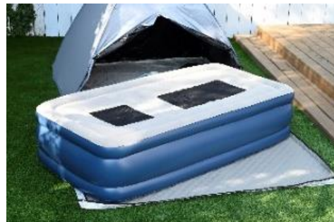
屋外 ※ での使用にもぴったり