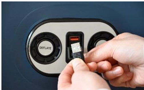
バッテリー搭載で USB 出力でのスマホ充電も可能