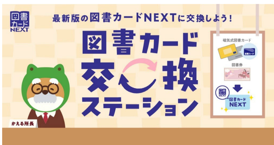
図書カード交換ステーション

“本の贈りもの”図書カードNEXTは、2025年4月16日(水)より、お手元で保管されている昔の磁気式図書カードや図書券を、最新版の図書カードNEXTへと交換するサービス、「図書カード交換ステーション」を始めました。