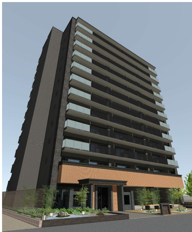
外観 イメージパース

当計画地である城東区は、大阪城の東に位置し緑豊かで落ち着いた住環境が広がっています。また、最寄駅である「今福鶴見」駅は Osaka Metro 長堀鶴見緑地線を有しており、「京橋」駅や「心斎橋」駅という大阪の中心地へダイレクトアクセスが可能です。