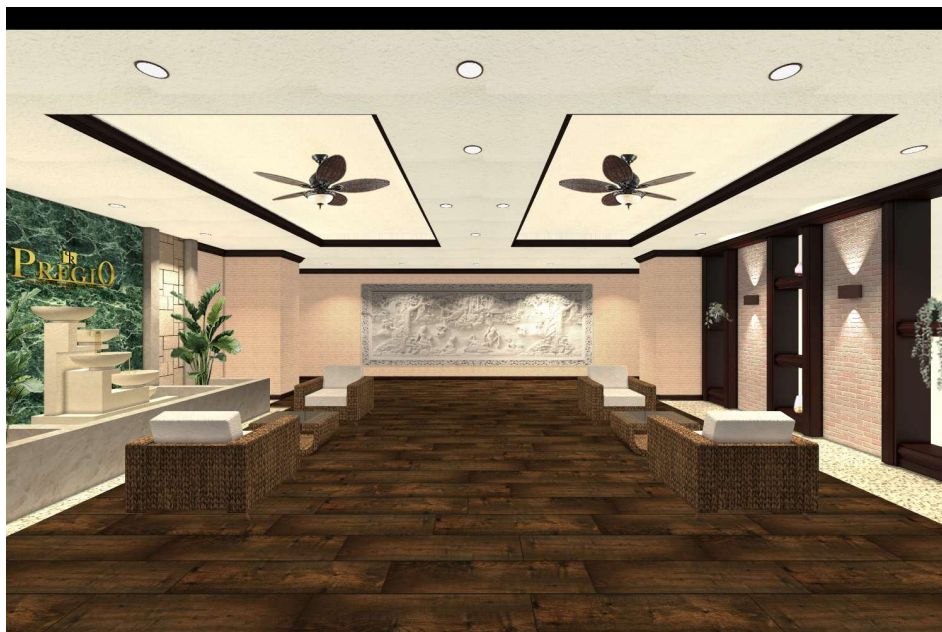
【エントランスホール イメージパース】

エントランスホールは、淡い色味の中で緑色の大理石の壁がアクセントとなり高級感あふれる空間となっております。正面には、バリ現地の職人が手彫りして製作したストーンカービングを設置し、ソファセットと相まってリゾートホテルのような空間を演出しています。