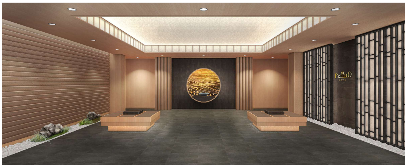
【エントランスホール イメージパース】

エントランスホールは、住まう人を優しく迎え入れる「和の迎賓空間」としてデザインされています。木の温もりを感じさせる質感豊かな素材と、柔らかな間接照明が調和し、静謐で落ち着きのある空間を演出しています。都市の喧騒を忘れさせる洗練された和の意匠が、日常の中に安らぎと高い品格をもたらします。