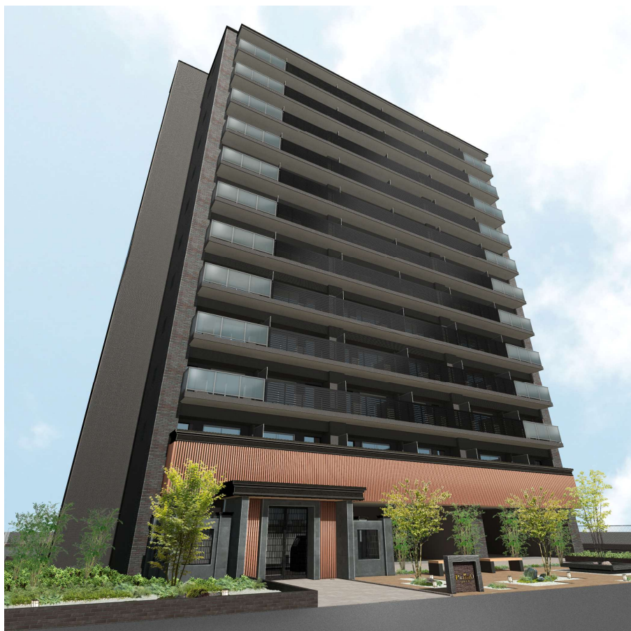
【外観 イメージパース】

当物件は、Osaka Metro 長堀鶴見緑地線「今福鶴見」駅より徒歩 12 分の場所に位置しています。京橋や心斎橋といった大阪市内主要エリアへ乗り換えなしでスムーズに移動でき、都心へのアクセスに優れています。物件周辺にはスーパーマーケットやコンビニエンスストア、大型商業施設などの生活利便施設が充実しており、都市の利便性を享受しながら快適に暮らせる住環境が整っています。