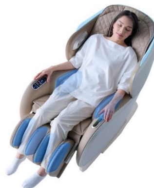
腰横と脚をエアーマッサージ

また、腰周辺には熱伝導率の高い「グラフェンヒーター」を配置しており、心地よく温まりながらマッサージをお楽しみいただけます。