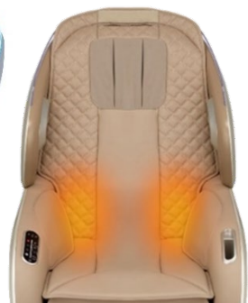
腰周りにヒーター搭載