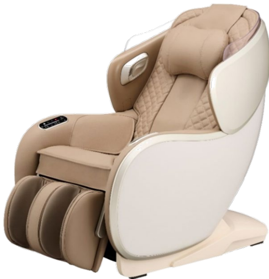
ベージュ×ベージュ(CC)

「SYNCA」は、高い機能性と洗練されたデザインで、上質で健康なライフスタイルを提案する美容健康ブランドです。2023年9月に当社と会社統合を行ったジョンソンヘルスケア株式会社で展開していたブランドを引き継ぎました。