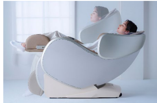
ゼロフロートリクライニング