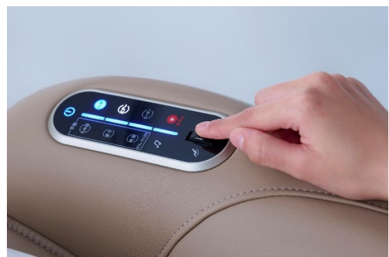
ユーザーインターフェース向上にこだわった操作部

左右に配置した Bluetooth®スピーカーはスマートフォンなどを接続し、お好きな音楽や内蔵の 5 つのヒーリングミュージックを流すことで、贅沢な音響空間を楽しめます。