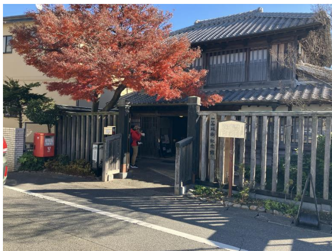
2024 年 12 月 7 日(土)流山市と共同で開催した TX 沿線トリップウォーク(一茶双樹記念館)

今回ご紹介した開業 20 周年記念イベントや特別企画の他にも、さまざまな企画や記念商品などをご用意する予定です。今後の詳細は、特設サイトにて都度発表いたします。ぜひ、ご期待ください。