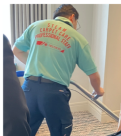
カーペットの状態に合わせて作業するスタッフ