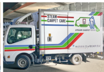
高温スチームを噴出できる専用特装车