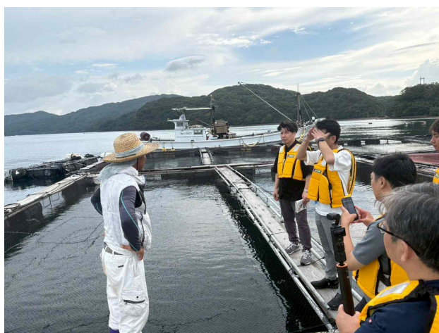
< 視察の様子 >