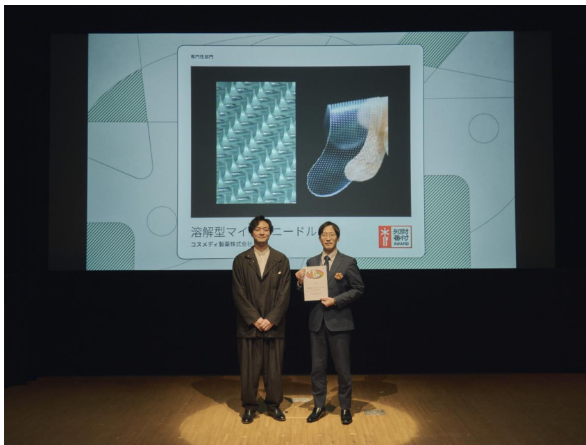
2026年4月8日(水)「第6回 知財番付」授賞式にて

「世界を進化させる可能性を持つ知財」として選出、イノベティブな発想と医療技術の可能性に評価