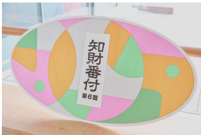
「第6回 知財番付」授賞式にて

今年で第6回を迎える本アワードでは、応用性・専門性・創造性・将来性の4部門で計40の知財が受賞。新たにテクノロジーやデザインを社会に根づかせ、文化として定着させたリーダーを称える賞「発明文化人(Invention Culture Person)」の表彰も行われるなど、技術を「道具」から「文化」へと昇華させる取り組みも開始しています。