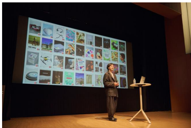
「第6回 知財番付」授賞式にて

■「知財番付」特設サイト https://banzuke.chizaiukan.com/