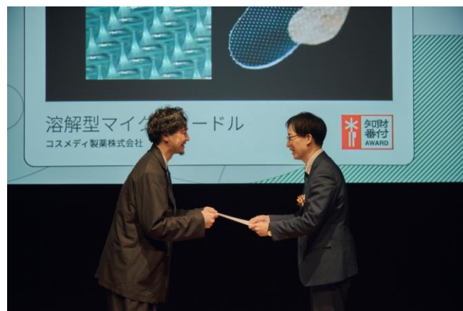
「第6回 知財番付」授賞式にて