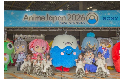
アンバサダー・着ぐるみ