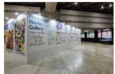
Production Works Gallery