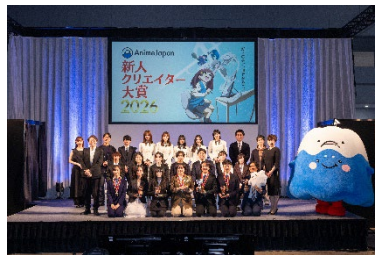
新人クリエイター大賞