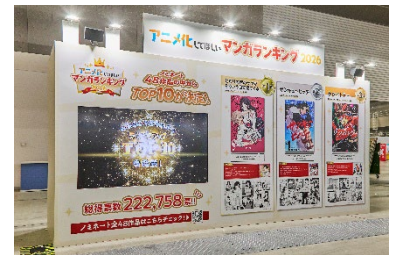
アニメ化してほしいマンガランキング