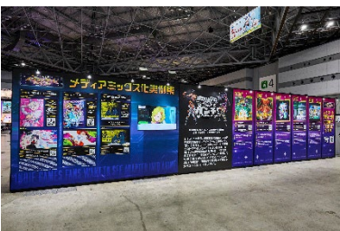
アニメ化してほしいゲームランキング