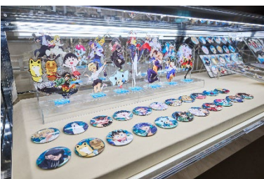
オフィシャルグッズ