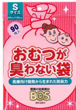
〈S サイズ 90 枚入〉