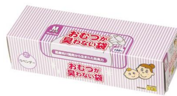
〈M サイズ 150 枚入〉