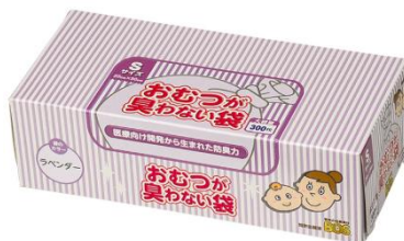
〈S サイズ 300 枚入〉