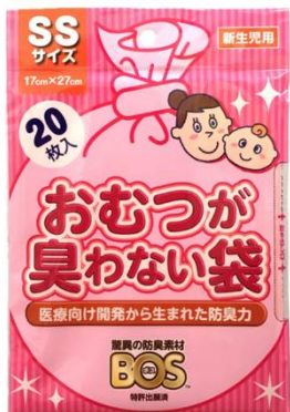
〈SS サイズ 20 枚入〉